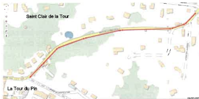
Figure 2 : Portion aménagée.