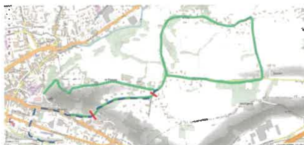
Figure 3. En rouge : limites de la portion aménagée. En vert : itinéraires de promenade des habitants des quartiers avoisinants. En bleu : itinéraire des cyclistes vers la gare de la Tour du Pin.

Ces aménagements ont été définis lors de deux réunions publiques avec les riverains et la Communauté de Communes reste Maître d'œuvre dans le cadre de son marché de voirie