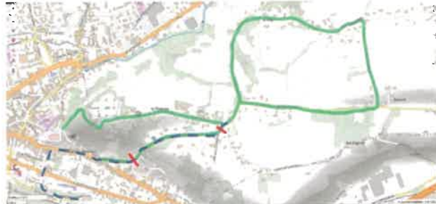
Figure 3. En rouge : limites de la portion aménagée. En vert : itinéraires de promenade des habitants des quartiers avoisinants. En bleu : itinéraire des cyclistes vers la gare de la Tour du Pin.

Ces aménagements ont été définis lors de deux réunions publiques avec les riverains et la Communauté de Communes reste Maître d'œuvre dans le cadre de son marché de voirie