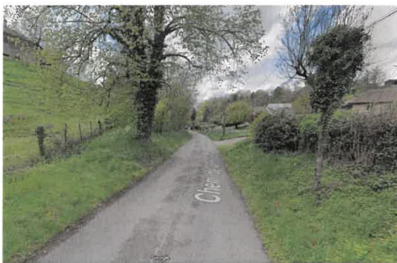
Figure 1 : Vue actuelle du Chemin de la Croix d'Evieu

DELIBERATION CONCERNANT UNE DEMANDE DE SUBVENTION AU DEPARTEMENT POUR DES TRAVAUX D'AMENAGEMENT DE LA VOIE COMMUNALE DE LA CROIX D'EVIEU Délibération N° 2024-05-03